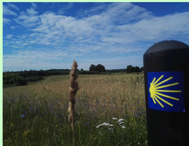
Pakeliui į Alytų ♦ On the way to Alytus

After leaving Raižiai, the next 20 kilometers of Camino route lead to Alytus city. It is recommended to ensure sufficient food and water reserves for this distance.