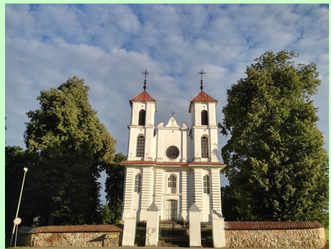
Punios šv. Apaštalo Jokūbo bažnyčia ◆ Church of St. James the Apostle in Punia

Išėjus iš Raižių, toliau piligrimų ir keliautojų laukia maždaug 20 kilometrų atstumas iki Alytaus miesto. Patariama pasirūpinti maisto ir vandens atsargų tiek, kad jų pakaktų įveikti šį atstumą.