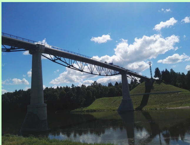
Baltosios Rožės pėsčiųjų ir dviratininkų tiltas Alytuje ♦ The pedestrian and bicyclist bridge of the White Rose in Alytus

Alytus yra vienas iš miestų Camino kelyje, kuriame rekomenduojama pasilikti ne tik kelionės nakvynei, bet ir verta skirti papildomą laiką pasivaikščioti pačiame mieste. Alytus didelis miestas, todėl būkite itin atidūs sekdami Camino ženklus ir saugokitės automobilių gatvėse.