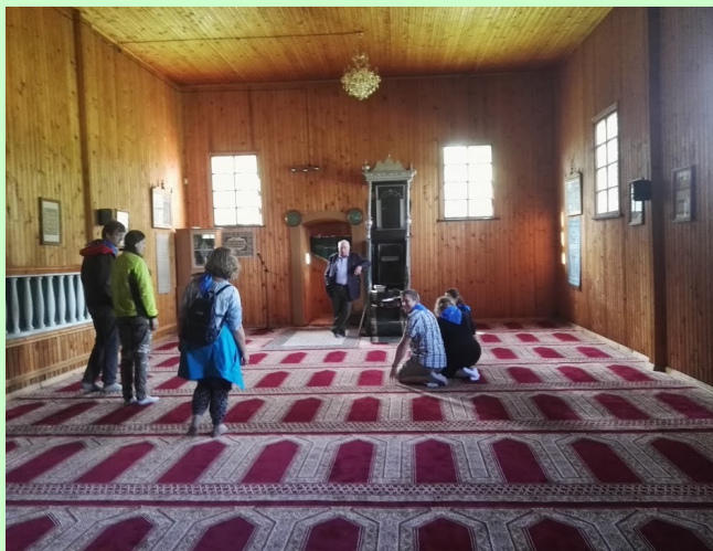
Raižių mečetėje ♦ In the Mosque of Raižiai