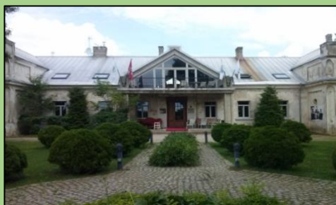
Žemaitkiemio dvaro rūmai iš kiemo pusės