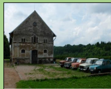
Žemaitkiemio dvaro svirnas su senų automobilių ekspozicija

Pasigrožėję dvaru ir atsikvėpę nuo kaitrios saulės spindulių patraukėmė link Kačiūniškės kaimo. Toliau leidomės Nevėžio slėniužemyn per Naujatrobių ir Maksvos kaimus (pasidarė smalsu, kodėl toks keistas kaimo pavadinimas?), kol priartėjome prie Kačiūniškių dvaro (Kauno rajono sav., Raudondvario sen., Kačiūniškės k.). Baltu dvaru galėjome pasigrožėti tik iš tolo, nes seserų benediktinių dvaras dabar jau yra privati nuosavybė. Čia stovi informacinis stendas, kuriame istorikai tvirtina, kad dvaras 1850 m. buvo įteisintas seserų benediktinių. Vienuolės turėjo didelį žemės plotą, kurį pačios tvarkė. Tačiau po 1863-ųjų metų sukilimo, caras atėmė dalį teritorijos ir perdavė rusakalbiams gyventojams. Kačiūniškės dvaras ir aplinkinės teritorijos buvo pervadintos į „Maskvą“. Nuo 1929 m. dvarą ir žemes vėl valdė vienuolės. Tai į Kultūros vertybių registrą įtrauktas objektas (KVR kodas 166). Dabar jau supratome kodėl kaimas vadinasi Maksva 😊. Pasigrožėję baltučiu Kačiūniškių dvaru ir šalia esančiomis kapinaitėmis, toliau tęsėme kelionę Nevėžio kraštovaizdžio draustiniu, per daug nenuotoldami nuo Nevėžio krantų. Jei kyla klausimas, kodėl ši upė vadinasi „Nevėžis“, atsakymą rasite tame pačiame mediniame stende prie Kačiūniškių dvaro 😊. Taip bediskutuojant pasiekiamė ir Biliūnus, kur laukia nakvynė.