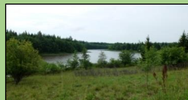
Viliojantis Krivėnų tvenkinys

pagyvina Krivėnų tvenkinys, kuris ilgą kelio atkarpą, vilioja ir kviečia žygeivius atsigaivinti nuo alinančio karščio. Pražygiavus apie 10 km Lietuvos lygumomis, apsėtomis auksaspalviais rugiais ir kviečiais prieiname Piepalių kaimą ir jo piliakalnį. Kalnas yra daugiau kaip 10 metrų aukščio, šlaitai statūs, tačiau į jį užkopti laisvai galima įrengtais takeliais. Nuo jo atsiveria vaizdas į srovenantį Nevėžį ir Babtų gyvenvietę. Pastarasis dar buvo vadinamas Babatyno, Babacinos, Žemaitkiemio piliakalniu. Piepalių piliakalnis yra įtrauktas į valstybės saugomų teritorijų sąrašą. Jam suteiktas KVR (Kultūros vertybių registras) kodas 40158. Prie piliakalnio pastebime lankytinų vietų nuorodą „Žemaitkiemio dvaras 1km“. Vadovaudamiesi šia nuoroda, greitai patenkame prie Žemaitkiemio dvaro (Adresas:Kauno rajono sav., Babatų sen., Žemaitkiemio k.). Kad ir kaip būsite pavargę jau po 11 žygio kilometro, tikrai nepraeisite nepastebėję susimąstyti verčiančio medinio užrašo „Ilgai ir laimingai PRASIDEDA ČIA“. Kodėl ilgai ir kodėl laimingai? O gi, Lietuvoje jau XVI a. Šiukštos įkūrė medinį Babatyno dvarą. Nuo 1697 m. valdant Prozorai prasidėjo dvaro mūrinių