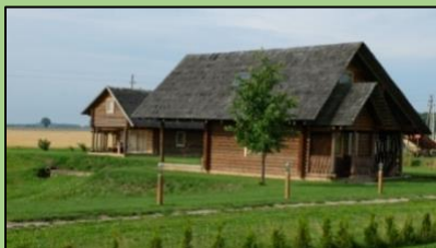
Nakvynės nameliai Gaižuvėlės sodyboje

Pernakvojus netoli Panevėžiuo esančioje Gaižuvėlės sodyboje (Gaižuvėlė, Striūnos g.38, Kauno rajonas, Babatų seniūnija), papusryčius ir papildžius vandens atsargas, žvalgybinė komanda išsiruošė į kelionę link Žemaitkiemio. Kelias driekiasi per vaizdingus laukus, nedidelius miestelius. Maršrutą