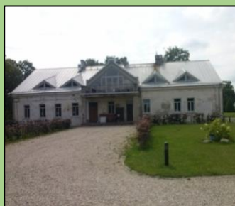
Žemaitkiemio dvaro rūmai