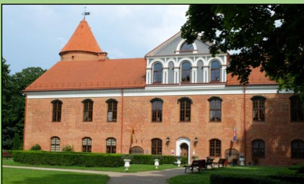
Raudondvario pilies rūmai su bokštu (pagrindinis pastatas)