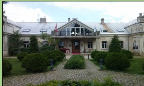
Žemaitkiemio dvaro rūmai iš kiemo pusės