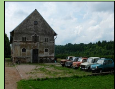
Žemaitkiemio dvaro svirnas su senų automobilių ekspozicija

Pasigrožėję dvaru ir atsikvėpę nuo kaitrios saulės spindulių patraukėmė link Kačiūniškės kaimo. Toliau leidomės Nevėžio slėniužemyn per Naujatrobių ir Maksvos kaimus (pasidarė smalsu, kodėl toks keistas kaimo pavadinimas?), kol priartėjome prie Kačiūniškių dvaro (Kauno rajono sav., Raudondvario sen., Kačiūniškės k.). Baltu dvaru galėjome pasigrožėti tik iš tolo, nes seserų benediktinių dvaras dabar jau yra privati nuosavybė. Čia stovi informacinis stendas, kuriame istorikai tvirtina, kad dvaras 1850 m. buvo įteisintas seserų benediktinių. Vienuolės turėjo didelį žemės plotą, kurį pačios tvarkė. Tačiau po 1863-ųjų metų sukilimo, caras atėmė dalį teritorijos ir perdavė rusakalbiams gyventojams. Kačiūniškės dvaras ir aplinkinės teritorijos buvo pervadintos į „Maskvą“.