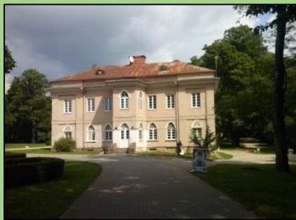
Raudondvario pietų oficina.