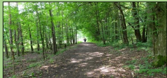
Pakeliui link Raudondvario