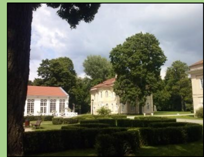
Raudondvario dvaro bendras vaizdas