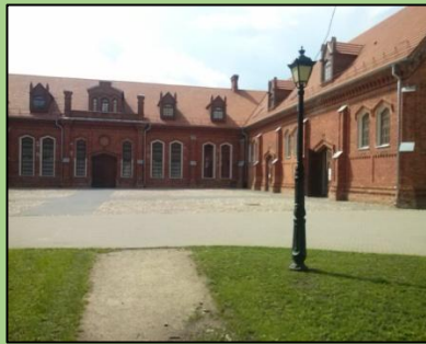
Raudondvario dvaro žirgyno pastatas