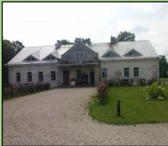
Žemaitkiemio dvaro rūmai