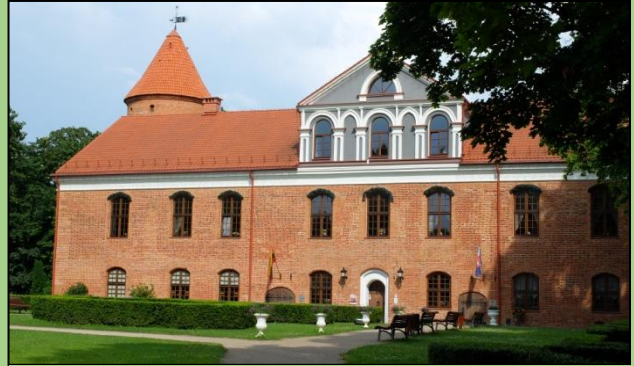
Raudondvario pilies rūmai su bokštu (pagrindinis pastatas)